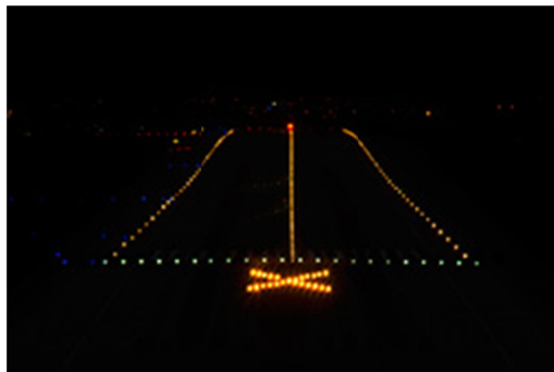
Visualisation de la croix fixe dans l'approche

A compter du 1 janvier 2018, les croix de fermeture lumineuses fixes font l'objet d'une évaluation opérationnelle dans les approches 08R/26L et 08L/26R. Cette dernière dure un an.