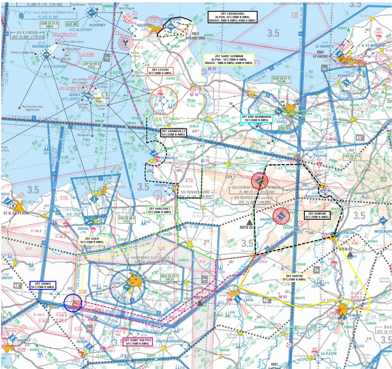
Extrait Carte 1 / 1 000 000 SIA - Edition 2-2025