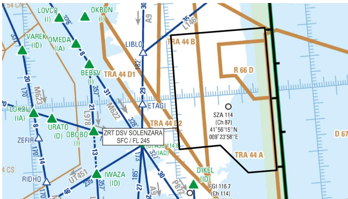
Extrait AIP France ENR6.2 Ed. 08/08/2024 – espace supérieur