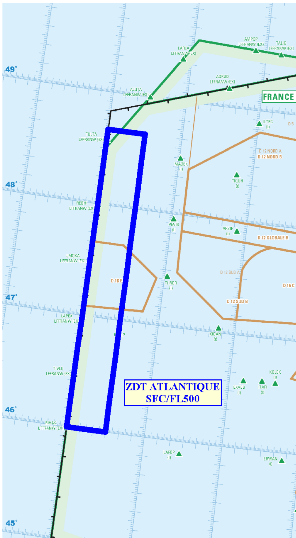
Extrait carte de croisière ENR 6.2 - Edition 2 - 2024