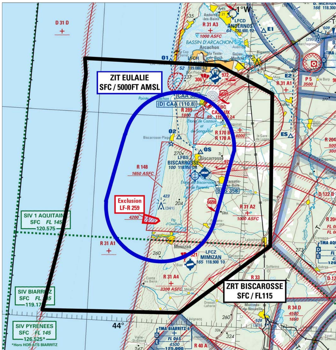
Extrait carte 1/1 000 000 SIA - Édition 2022