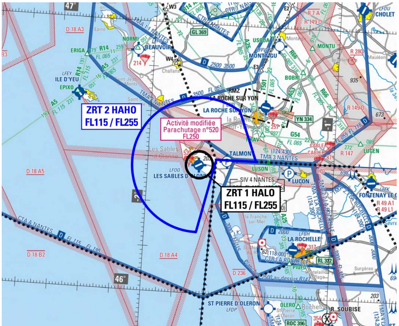
Extrait carte 1/1 000 000 SIA - Édition 2022

Lieu : FIR : Brest LFRR - AD : Les Sables d'Olonne LFOO