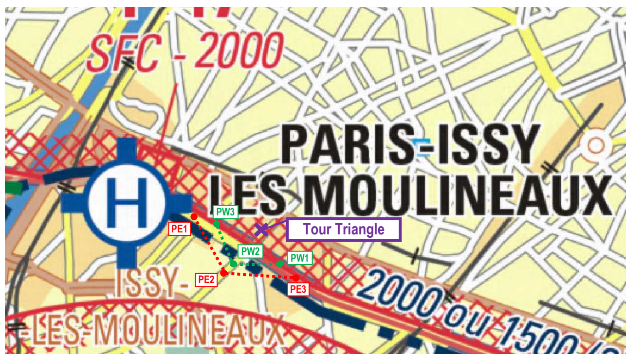
Extrait carte SIA 1 / 100 000 - Edition 2021

Le chantier de cette tour étant planifié jusqu'en 2025, plusieurs suppléments à l'AIP seront successivement publiés afin de couvrir les différentes phases des travaux.