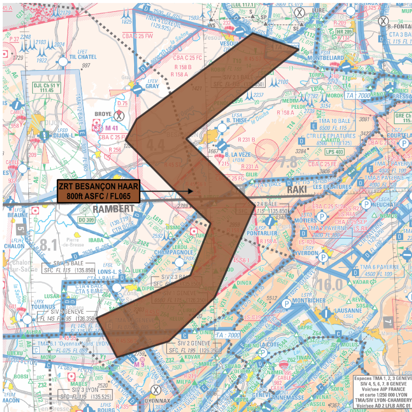
Extrait Carte 1 / 1 000 000 SIA - Edition 2 - 2025